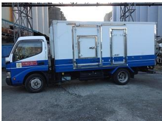
冷凍冷蔵 2t ロング 箱