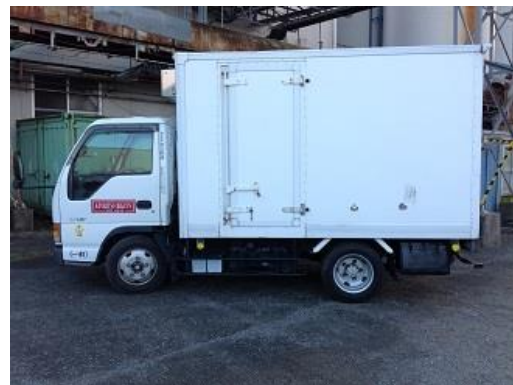
冷凍冷蔵 2t ショート 箱