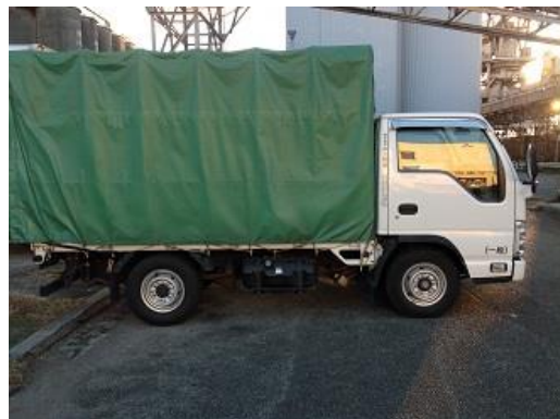
2t 幌 ショート