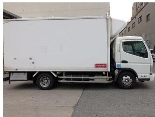
冷凍冷蔵 3t ロング 箱